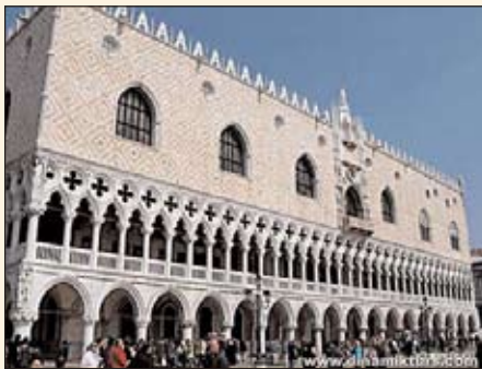
Дуждева палата у Венецији

Венеција има бројне надимке попут: Серени-