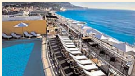
Базен на крову хотела Ла Меридиен

Такође, једна од атракција је и аеродром, други по величини у Француској, постављен на плочама у мору, са кога се дневно обави 45 летова за Париз. Разни фестивали и карневали у Ници уносе у живот изу-