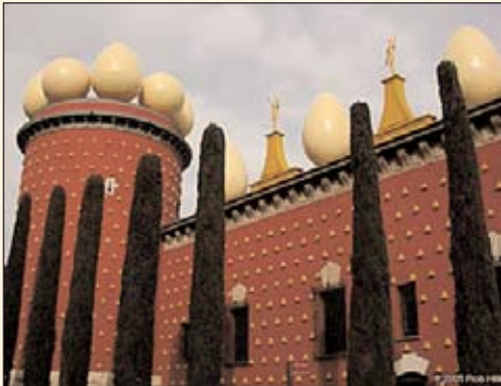
Фигуерас, Салвадор дали