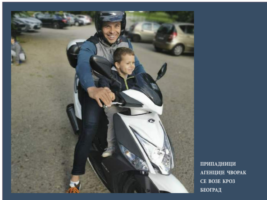
ПРИПАДНИЦИ АГЕНЦИЈЕ ЧВОРАК СЕ ВОЗЕ КРОЗ БЕОГРАД