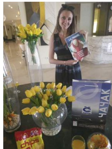
БЕЗБРИЖНО СА 1А ТРАВЕЛОМ